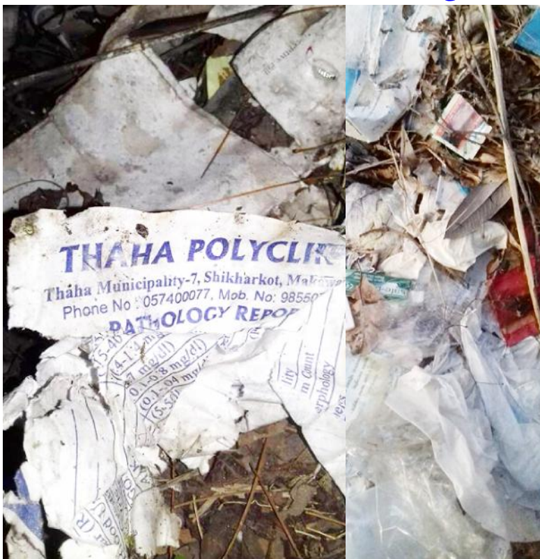
थाहा पोलिक्लिनिकले खानेपानीको मुहान नजिकै फालेको अस्पतालजन्म फोहोरहरू ।

फोहोर फालेको देखेपछि अहिले थाहा-४ भुईँडाका बासिन्दाले धाराको पानी खाने छोडेका छन् । स्थानीय भूखुने ओझारको मुहानबाट ल्याएको खानेपानी आयोजना अन्तर्गत किटेनी र भुईँडाका करिब तीनसय परिवारले पिउने गर्थे । अहिले खाने छोडेका छन् ।