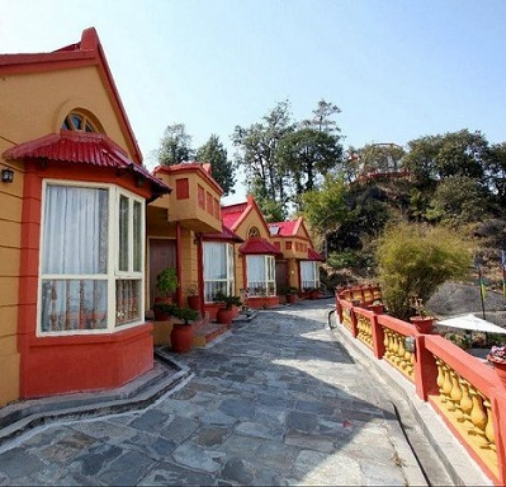
थाहा-४ मा रहेको एम्बरेष्ट पानोरमा रिसोर्ट ।

थाहानगरमा साविकका छ वटा गाविस गाभिएका छन् । जबकि थाहानगर पर्यटकीय नगर भएकोले नगरको अधिकांश क्षेत्रमा साना ठूला होटल तथा होमस्टे व्यवशाय संचालनमा रहेका छन् । नगरपालिकामा एकीकृत सम्पती कर तथा व्यवशाय कर नतिने होटलहरूमा एम्बरेष्ट पानोरमा रिसोर्ट दामन सहित नगरकै अर्को प्रमुख पर्यटकीय गन्तव्य थिल्लाङ, बज्रवाराही, पालुङ, दामन, आग्रा तथा टिष्टुङका दर्जनी होटल व्यवशायीहरू रहेका छन् । नगरमा दर्ता भएका होटल व्यवशायीहरूले पनि आफ्नो व्यवशाय वार्षिक रूपमा नवीकरण गर्न अटेर गर्ने गरेको लामिछानेले बताए । उनका अनुसार-आर्थिक वर्ष २०७४/०७५ को हालसम्मको अवधिमा नगरपालिकामा ६ सय ६७ वटा व्यवशायी दर्ता भएका