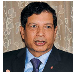
8f= z$|k| fb zdf{

त्यसको सफल कार्यान्वयन गर्न गम्भीर भएको देखिन्छ । दक्षिण अफ्रिकामा स्थानीय तहलाई प्रत्यायोजित संवैधानिक अधिकार प्रदेश सरकारलाई दिइएको भन्दा बढी छ । सबै स्थानीय सरकार अर्थात् नगरपालिकामा दिइएको अधिकार समान भए पनि तिनको आकार, राजस्वको स्रोत र विकासको स्तर फरक छ । यही कारण उनीहरू आफ्नो राजनीतिक र आर्थिक अधिकार कार्यान्वयन गर्ने पक्षमा समान छैनन् । कम स्रोत र क्षमता भएका स्थानीय सरकारलाई अधिकार प्रयोग गर्न गाह्रो छ । उनीहरूले राजनीतिक रूपमा पाएको