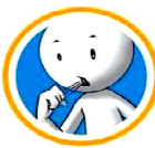
रुघा र खोकी

"कोरोना भाइरस प्रभावित देशहरूबाट आउने मानिसहरूमा दुई हप्ता भित्र रुघाखोकी लागेमा, ज्वरो आएमा, धाँटी/टाउको दुखेमा, ध्वासप्रधासमा आत्याधिक समस्या भएमा तुरुन्त नजिकको स्वास्थ्य संस्थांमा सम्पर्क गर्ने ।"