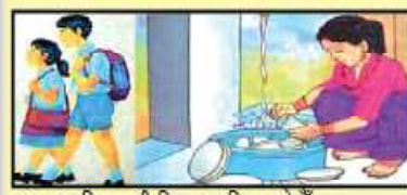
बालविवाह गरी शिक्षाबाट वञ्चित नहोऔं ।