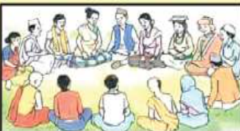
बालविवाह अन्त्य गरौं ।