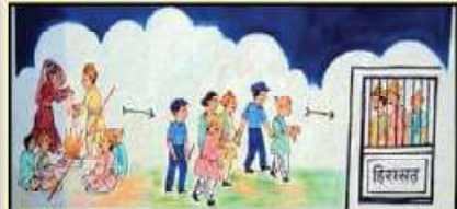
बालविवाह कानूनी रूपमा दण्डनीय छ । कानूनको पालना गरौं, गराऔं ।

बालविवाह सामाजिक अपराध हो । बालविवाह नगरौं, नगराऔं ।