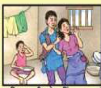
बालविवाह गरी धेरैजु हिंसाका नफसा ।

बालविवाहका कारण कम उमेरमा गर्भवती भई स्वास्थ्यलाई जोखिममा पार्छौं ।