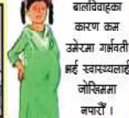
बालविवाहका कारण कम उमेरमा गर्भवती भई स्वास्थ्यलाई जोखिममा नपारौं ।