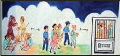
बालविवाह कानूनी रूपमा दण्डनीय छ । कानूनको पालना गरौं, गराऔं ।

बालविवाह सामाजिक अपराध हो । बालविवाह नगरौं, नगराऔं ।