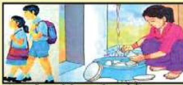
बालविवाह गरी शिक्षाबाट वञ्चित नहोऔं ।