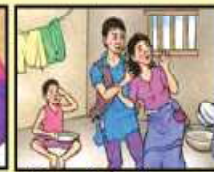
बालविवाह गरी धेरैजु हिंसामा नपर्सौं ।