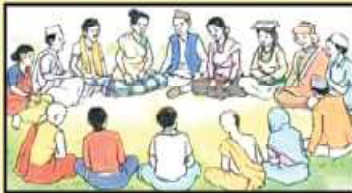
बालविवाह अन्त्य गरौं ।