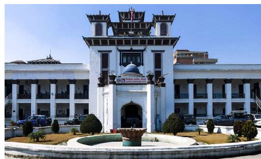
विवरण सार्वजनिक नगर्ने राजनीतिक दल वा उमेदवारलाई आयोगले पन्ध्र हजार रूपैयाँसम्म जरिवाना गरी विवरण सार्वजनिक नगर्ने आदेश दिन सक्ने उल्लेख छ ।

ऐनको उपदफा ४ मा विवरण सार्वजनिक नगर्ने राजनीतिक दल वा उमेदवारलाई आयोगले पन्ध्र हजार रूपैयाँसम्म जरिवाना गरी मनासिब समय तोकौ त्यस्तो विवरण सार्वजनिक गर्न आदेश दिन सक्ने उल्लेख छ । त्यसोतः ऐनको दफा ३१ को उपदफा ५ मा आम्दानी खर्चको विवरण सार्वजनिक नगर्ने राजनीतिक दल वा उमेदवारलाई आयोगले पटकै पिच्छे पन्ध्र हजार रूपैयाँ