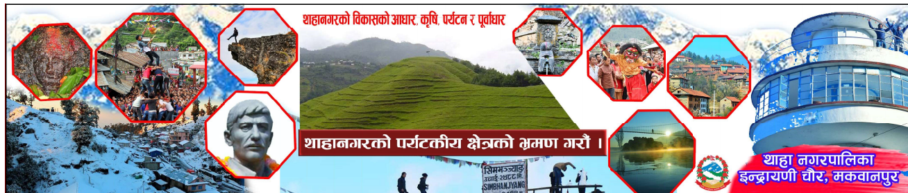
शाहानगरको विकासको आधार, कृषि, पर्यटन र पूर्वाधार