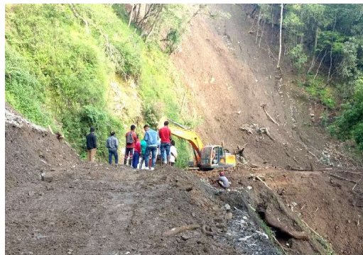
इन्द्रसरोवर गाउँपालिकाको सिम्लाङ-कलंकी सडक खण्ड।

मानवनिर्मित जलाशय इन्द्रसरोवर र त्यस क्षेत्रको प्राकृतिक एवं ऐतिहासिक संरचनाका कारण पछिल्लो समय मार्खु-इन्द्रसरोवर क्षेत्र प्रदेशकै प्रमुख पर्यटकीय गन्तव्य बन्दै गएको छ। इन्द्रसरोवर गाउँपालिका-१ मा पर्ने उक्त मार्ग वर्षामा हिलाम्भे र हिउँदमा धुलाम्भे हुने गरेको छ। पर्यटक र स्थानीयलाई आवागमनमा असहज भएपछि वडा कार्यालयले चासो राख्दै स्तरोन्नतिका लागि लामो समयदेखि