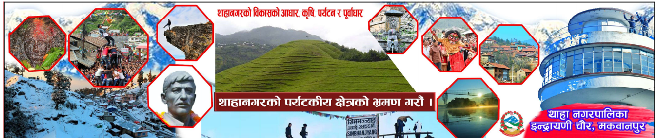
थाहानगरको विकासको आधार, कृषि, पर्यटन र पूर्वाधार

स्थानीयहरुले कालिबजार सामुदायिक वन उपभोक्ता समितिका