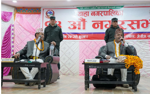
विकास संवाददाता थाहानगर

मकवानपुर थाहा नगरपालिकाको १४ औं नगरसभा भएको छ । २५ पुसमा पालुङ जेसिज सभाहलमा भएको सभाले चालु आर्थिक वर्ष २०८०/८१ को हालसम्मको समीक्षा सहित केही आयोजनाहरू संशोधन तथा रकमान्तर गरेको छ । सभाले समीक्षा र रकमान्तरको प्रस्तावहरू बहुमतले पारित गरेको छ ।