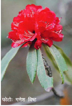
फोटो: गणेश विष्ट