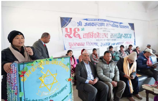
जनकल्याणको ५६ औं वार्षिक उत्सव